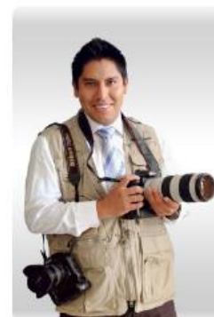
Sala de prensa