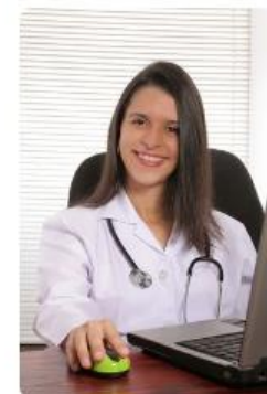
Salud en línea