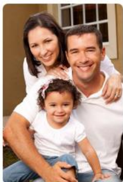
Derechohabientes, pensionados y público en general

Este trámite es personal, las instrucciones es un material de apoyo y la escuela no tiene el dominio de su información ni de su registro. Debes tener a la mano tu CURP – Correo electrónico válido y con acceso - Código Postal – Verificar hasta tres veces que la información sea correcta.