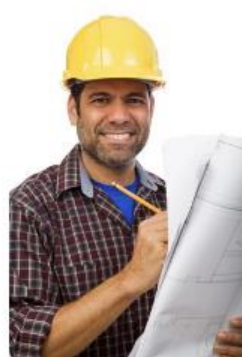
Proveedores del IMSS