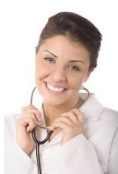
Profesionales de la salud