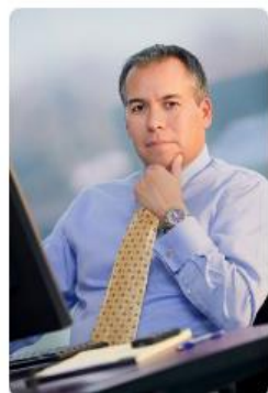
Patrones o Empresas